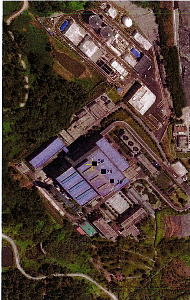
图例: ■ 固体废物采样点