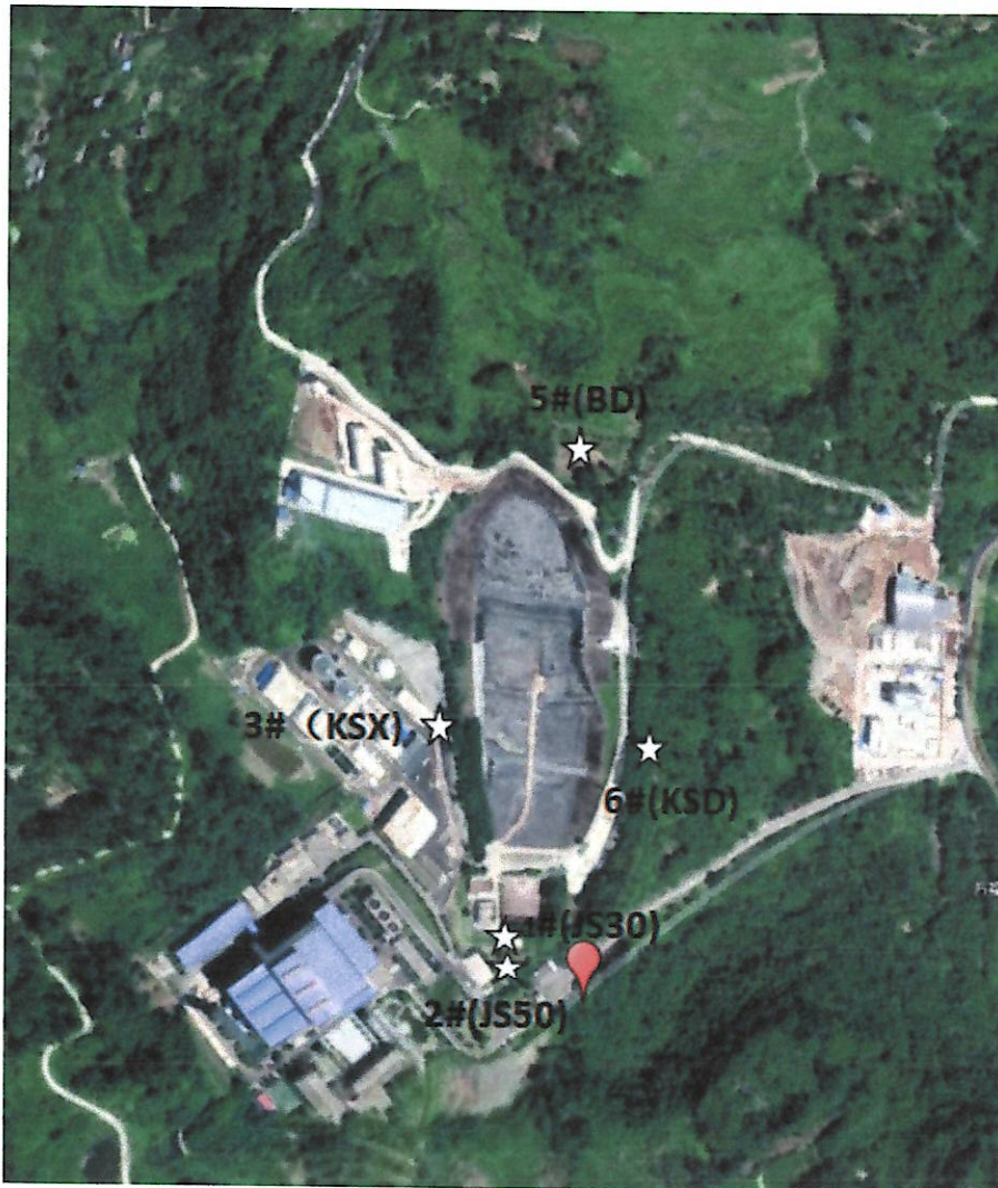
图例：☆ 地下水采样点