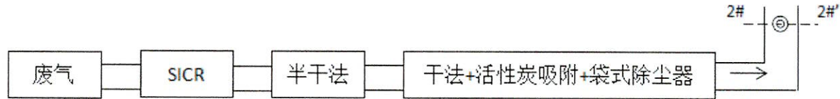
2#锅炉废气排放取样口